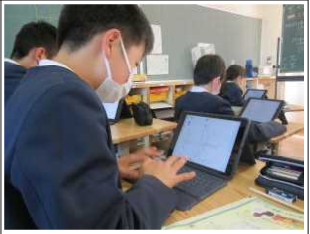
【6年算数】タブレットを使用し考え中。