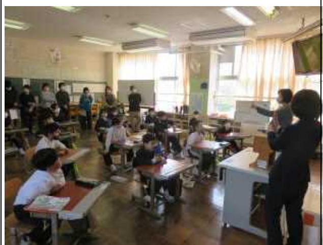
【3・4年国語】先生の話をよく聞いています。