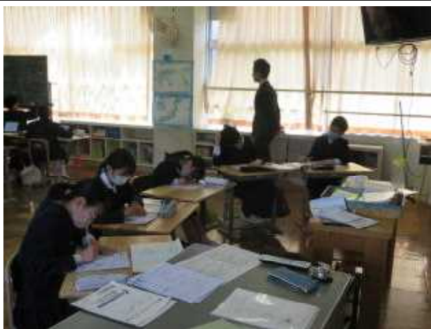
【5年算数】説明後、自分でチャレンジ。