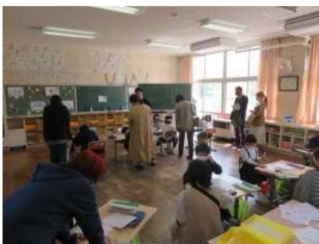
【1・2年国語】みんな張り切って勉強しています。